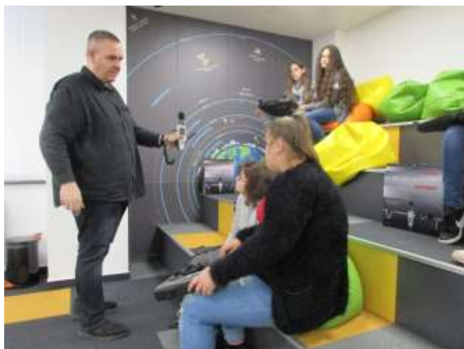
Titkok Háza: a csillagászat alapjai