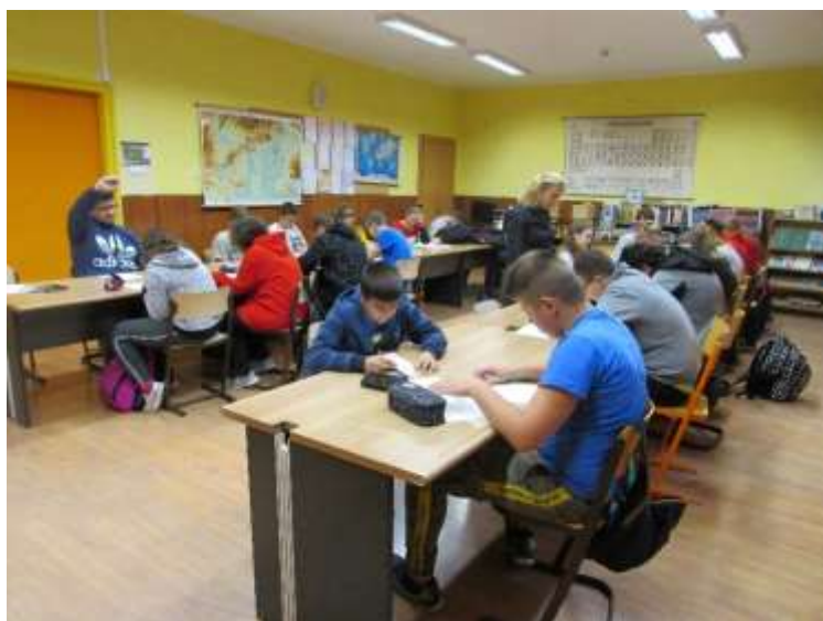
Önismeret és serdülőkor – az ÁNTSZ programja