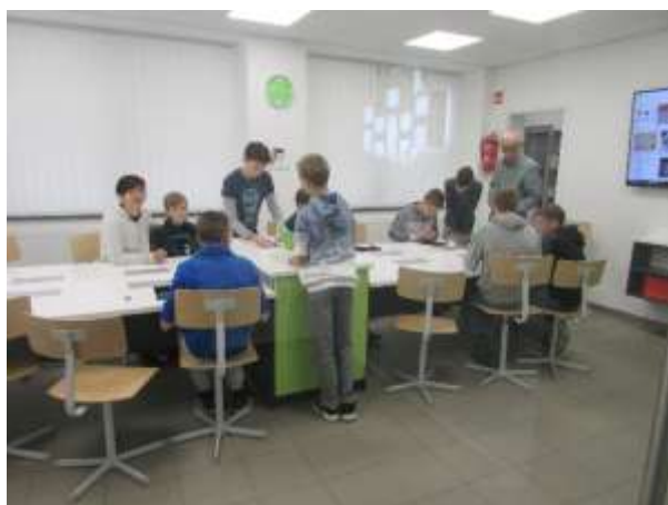
Titkok Háza: bűnügyi labor, ujjlenyomat-vizsgálat