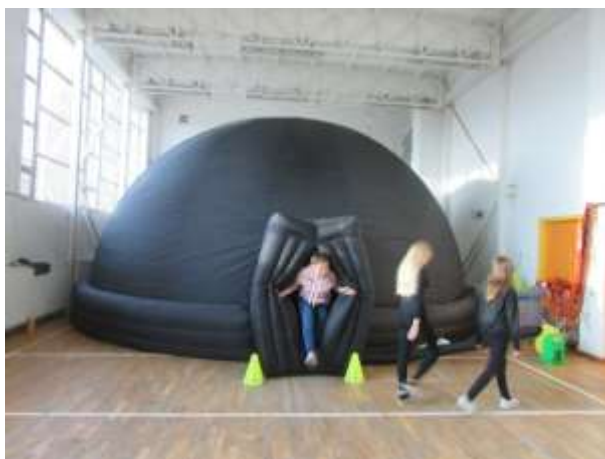
Mobil-planetárium az iskolában