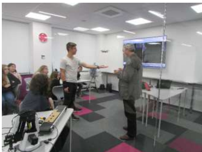
Titkok Háza: drón-reptetés