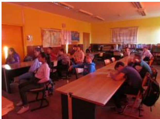
Tudnivalók az oltásokról