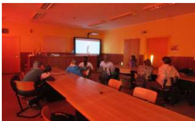
Egészséges életmód kialakításához kaptak tanácsokat a hatodikosok