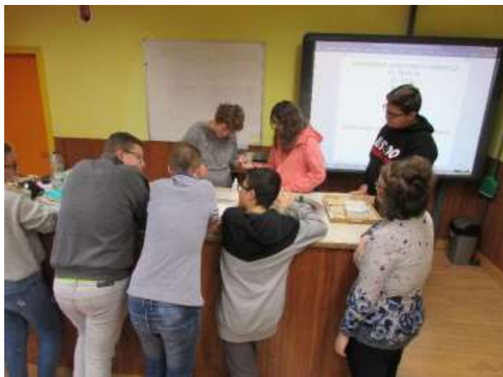
Vércsoport-meghatározás a nyolcadik osztályban