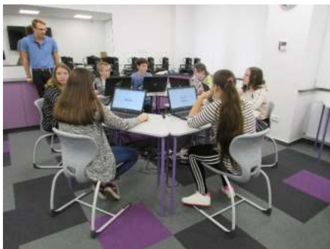
Titkok Háza: 3D-s tervezés, nyomtatás