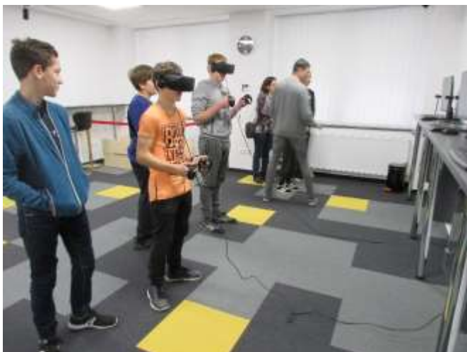
Titkok Háza: kalandozás a virtuális világban