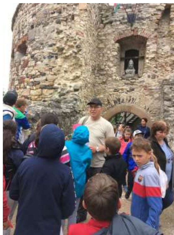
A Pálos kolostornál - A vár bejárata előtt