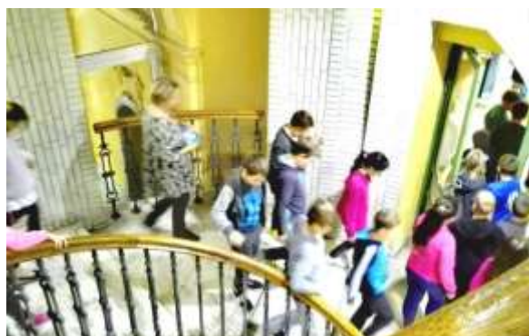
Séta a lépcsőházban.