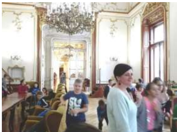
Az egymásba nyíló olvasótermek