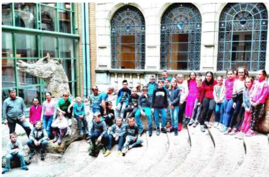
Csoportkép a Fővárosi Szabó Ervin Könyvtár sárkánya előtt a belső udvaron.

Az épületben mindenhol könyveket tároltak a falak polcain. Ritkán látogatható helyekre is elkalauzoltak bennünket. Hihetetlen a mai kor emberei számára, hogy volt korszak, amikor ekkora pompa vette körül az embereket.