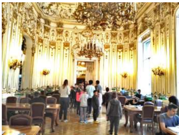
Csendes séta az olvasóteremben.