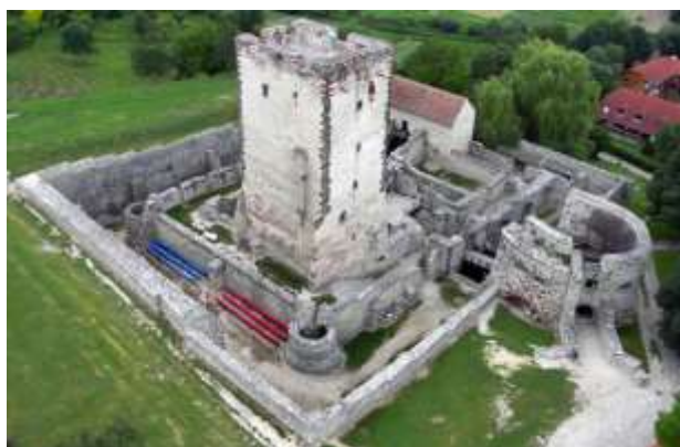
Kinizsi vár, Nagyvázsony