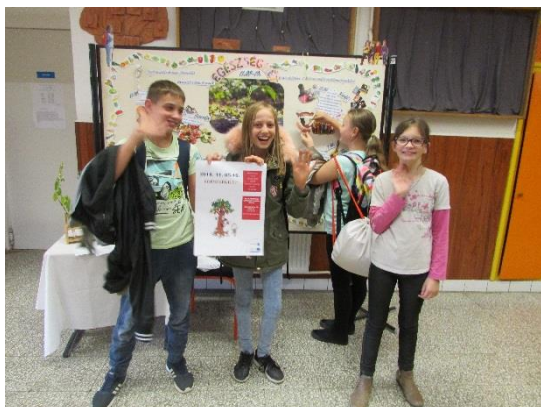
Interaktív falíújságról tájékozódunk