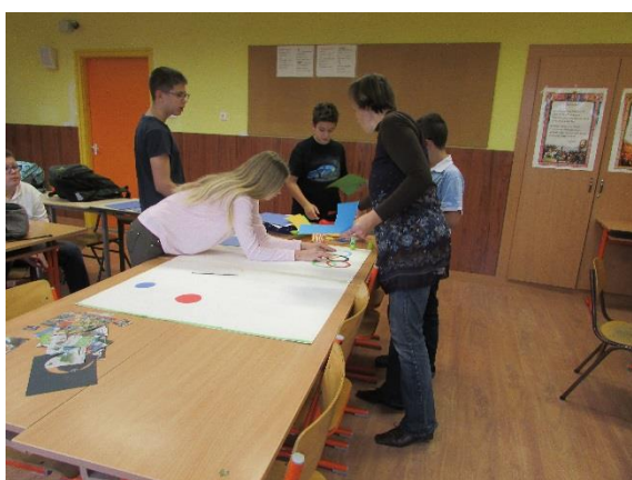
„Gyorsabban, magasabbra, erősebben!” Olimpiai játékok – angol órán