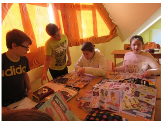
Hétfégi akciók - %-számítás matekórán